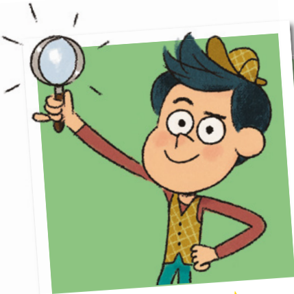
★ Sherlock ★

Sherlock tiene siete años y vive rodeado de enigmas. Su padre, el gran Sherlock Holmes, le ha enseñado a descifrarlos desde su más tierna infancia. Como buen detective, nunca sale de casa sin su lupa.